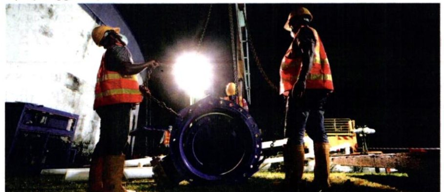
Air Selangor melaksanakan kerja-kerja penyenggaraan berjadual dengan perancangan rapi walaupun pada waktu malam.