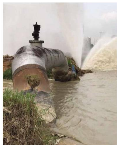
Scheduled maintenance work is crucial to avoid any sudden pipe burst incidents.

If we do not conduct the maintenance work as scheduled, it will be highly likely to cause unscheduled water disruption, due to unsuspecting breakdown of the pump house equipment, water treatment plant assets, or pipe burst which will consequently affect the consumers. As such, the implementation of scheduled maintenance work can reduce the probability of unscheduled water disruption occurring.