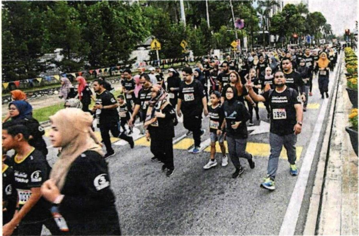
■ 莎阿南无车日活动将于11月复办。