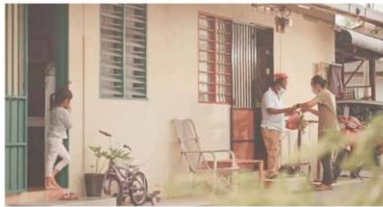
Digi's Teladan is about the younger generation who witness the hope, resilience and compassion in us, even in these difficult times.