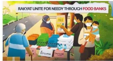
Rakyat Heroes by Taylor's University shows us that heroes can be ordinary folk like you and me.