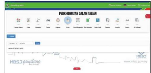
A screenshot of the Ezy MBSJ portal, which can handle various transactions including licence renewal and assessment tax payment.

Those facing problems with their applications or renewals, or need to submit documentation are required to make an appointment via https://bit.ly/3kmVufB before visiting the Licensing