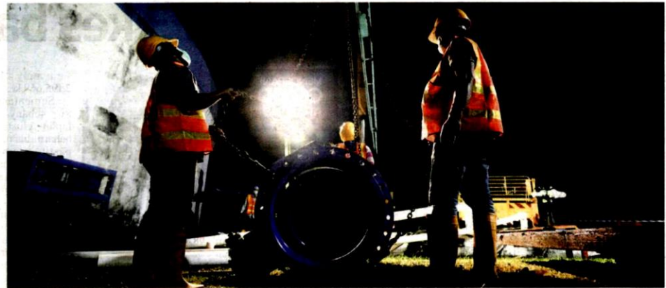
Air Selangor melaksanakan kerja-kerja penyelenggaraan berjadual dengan perancangan rapi walaupun pada waktu malam.

Kebiasaannya, semasa kerja-kerja penyelenggaraan dilaksanakan, para pengguna akan menghadapi gangguan air berjadual. Apakah proses yang berlaku semasa gangguan bekalan air berjadual?