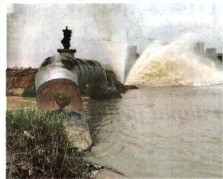
Kerja penyenggaraan berjadual sangat penting untuk mengelakkan insiden paip pecah diluar jangkaan.