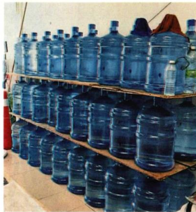
此次制水期限，助长10公升矿泉水销量大增。

雪州大臣拿督斯里阿米鲁丁在本周四(7日)宣布，雪州供水管理公司(Air Selangor)应雪河第一期滤水站提升及维修工程启动，将于13日上午9时起至16日晚上9时为止，将展开4天的制水措施，届时共有998个雪隆地区的用户将受到影响。