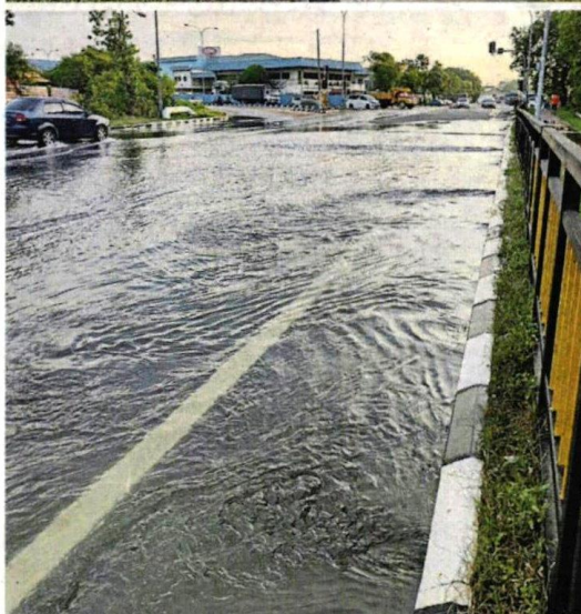
■ 海潮高涨，导致一些地区水淹马路，不过情况还算受控。