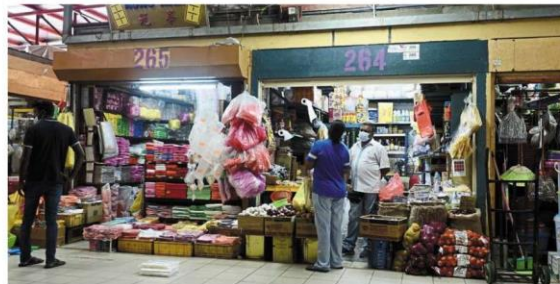
Business operators and stall licensees can pay and print the new MBPJ licence without having to go to city council’s counters.

MBPJ advises operators, micro entrepreneurs and dog owners to do so via dedicated online portal