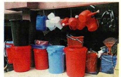
五花八门的水桶，任君选购。