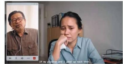
Boustead Properties' Erti Perjuangan is about the emotional hardship that Aaliyah and her father endure as citizens who fight to free the nation from an invisible enemy.

KUALA LUMPUR: Festive seasons are when Malaysians look forward to new commercials that are always memorable, entertaining or heart-wrenching.